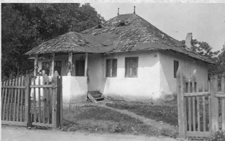
CASA DIN STR. LICEULUI No. 12.--VI 1931